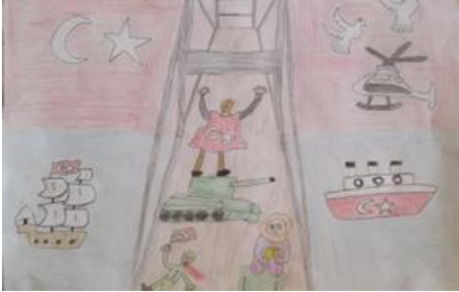
3.Büşra SORGUN 4/A