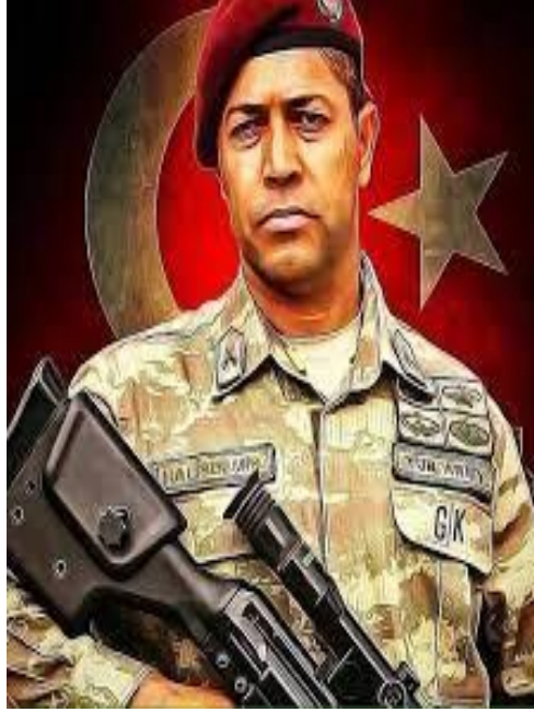
ŞEHİT ÖMER HALİSDEMİR 20 ŞUBAT 1974-16 TEMMUZ 2016